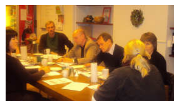
Frá stjórnarfundum 24. nóvember 2009.

Haldnir voru þrjár stjórnarfundir árið 2009. Í fyrsta skipti sögu Geysis settist klúbbfélagi í stjórn Klúbbsins. Á fundum stjórnar eru tekin fyrir málefni klúbbsins er varða rekstur, fjárhag, stefnumótun og skipulag. Stjórnin samþykkir ársreikninga, ársskýrslu og framkvæmda-áætlun klúbbsins.