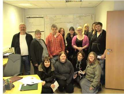
Nemendur í Borgarholtsskóla í kynningu ásamt félögum og starfsfólki í Geysi

Kynningar voru með hefðbundnum hætti. Sjálfstætt starfandi geðlæknar og sálfræðingar hafa í auknum mæli vísað skjólstæðingum sínum á klúbbinn sem þátt í endurhæfingu þeirra. Reynt er að koma til móts við þarfir hvers og eins um kynningar. Einnig hefur Klúbburinn haldið kynningar á geðdeildum LSH og víðar. Aðstandenda- og kynningardagur var haldinn 5. júní og tókst hann í alla staði mjög vel. Á alþjóðlegum degi sjúkraliða kynnti Klúbburinn Geysi starfsemi sína. Félagsliðanemar og hjúkrunarfræðinemar og sjúkraliðanemar hafa einnig verið mjög duglegir að kynna sér starfsemi klúbbsins.