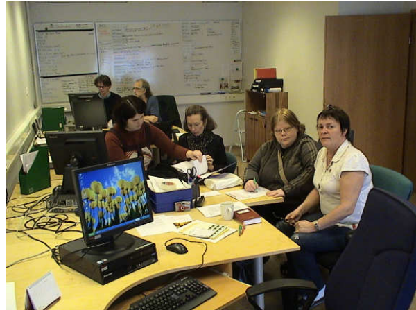
Starfsfólk og félagar í dagsins önn á skrifstofunni.

Skrifstofu, atvinnu- og menntadeild halda sameiginlega deildarfundum. Til daglegra verkefna á skrifstofunni telst skráning á viðveru félaga og gesta. Auk þess útgáfa Hádegisfréttanna sem er daglegt fréttabréf klúbbsins. Kynningarefni er prentað, brotið og heftað. Dagskrá og fundargerðir húsfunna eru ritaðar og prófarkalesnar. Unnið er að þýðingum á erlendum greinum sem tengjast starfsemi klúbbhúsa og notaðar við uppbyggingu starfsins. Haldið er utan um alla tölfraði um starfsemina og skráningu á henni. Einnig sér skrifstofudeildin um úthringingar til félaga í deildinni.