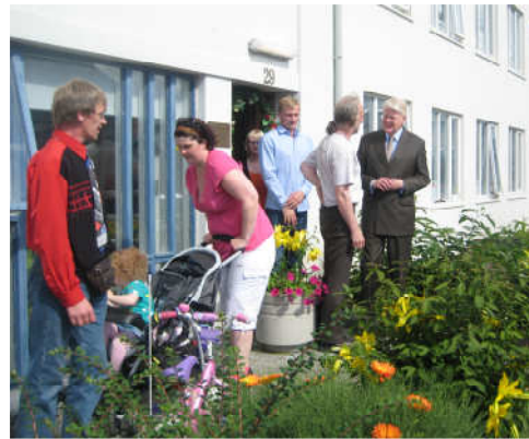
Ólafur Ragnar Grímsson forseti Íslands ræðir við félagar.