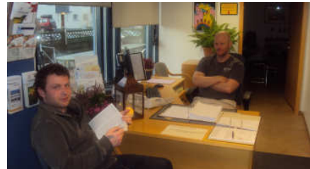
Tveir félagar sinna móttökunni.

Móttakan er mikilvægur þáttur í starfseminni. Þar er meðal annars svarað í síma, tekið á móti félögum og gestum, tekið á móti pósti sem berst og fyllt á rekka fyrir bæklinga og blöð. Þar er einnig hægt að finna allar auglýsingar og tilkynningar sem tengjast klúbbsstarfinu. Farið var í áttak til að efla móttöku og bæta mönnunina þar. Útbúin var stundarskrá og boðið var upp á að vera í móttöku í hálf tíma í senn sem mæltist vel fyrir.