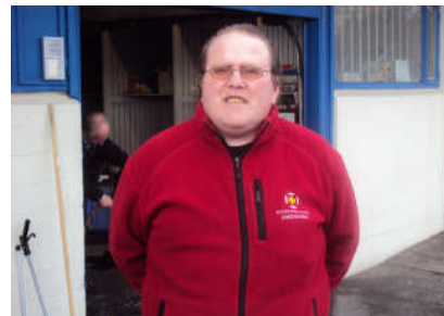
Geysisfélagi í RTR á BSÍ.

Í ársbyrjun hafði Klúbburinn yfir að ráða sex störfum í Ráðningu til reynslu (RTR). Eitt hjá Félagsmálaráðuneytinu og þrjú hjá Velferðarsviði Reykjavíkurborgar og tvö hjá Bifreiðastöð Íslands (BSÍ). Störfin á BSÍ komu ný inn á árinu, tveir félagar sinna þeim störfum til skiptis, viku í senn. Níu félagar fóru í gegnum ráðningu til reynslu á árinu.