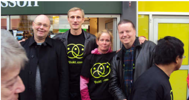
Myndin er tekin 10. október í Mjódd af félögum í Geysi.

Klúbburinn tók þátt í Alþjóðlega geðheilbrigðisdeginum sem haldinn var hátíðlegur þann 10. október. Að þessu sinni fór dagskrá fram í Mjóddinni. Þetta er í fyrsta skipti sem haldið var upp á daginn í Mjóddinni og þótti það takast með ágætum. Unnið var að undirbúning frá því í ágúst. Hugmyndafræði Klúbbsins var kynnt, auk þess sem klúbburinn var með fjáröflunarmarkað til styrktar klúbbum. Geysir og Hugarafli höfðu umsjón með uppsetningu og skipulagi myndlistarsýningar.