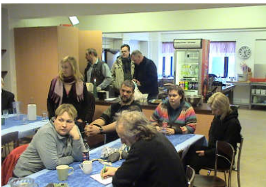
Félagar hlýða á niðurstöðu úttektarinnar.

Vikuna 2. til 6. febrúar kom vottunarteymi frá ICCD til þess að taka út klúbbinn. Niðurstaða heimsóknarinnar var að Geysir fékk skilyrta vottun til þriggja ára gegn því að bætt yrði úr ýmsum þáttum starfseminnar sem ekki þóttu fullnægjandi samkvæmt athugunum /niðurstöðum teymisins. Skýrslu þess efnis var skilað ICCD í febrúar/mars 2010. Á árinu hefur verið unnið mjög mikið starf til þess að afla þeirra gagna sem ekki þóttu gerð nægileg góð skil í klúbbum og þeir þættir lagaðir sem betur máttu fara. Einn fundur starfsmanna, framkvæmdastjóra og stjórnarformanns var haldinn til þess að ræða viðbrögð við vottunarniðurstöðunum.