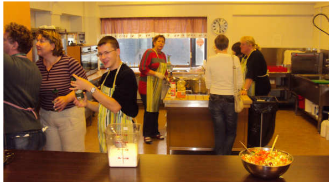
Undirbúningur hádegisverðar í eldhúsdeild.

Eldhús- og viðhaldsdeild halda sameiginlega deildarfundir. Í eldhúsdeildinni er eldaður matur fyrir að meðaltali 16 manns á dag, bæði félaga, starfsmenn og gesti. Alls voru seldir 4.024 matarskammtar á árinu bæði hádegismatur og kvöldmatur á opnu húsi ásamt veislum. Til daglegra verkefna eldhúsdeildar telst; matseld, bakstur, upp-