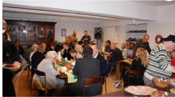
Frá 10. ára afmælisveislu Geysis.