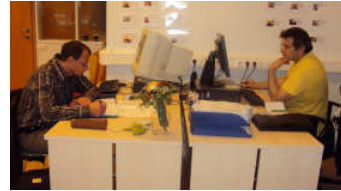
Félagar í tölvuveri Geysis.

Námskeiðahald innan klúbbsins hefur aukist til muna. Munar mikið um eflingu ATOM (atvinnu- og menntadeildar), þar sem félagar og starfsfólk hafa meðal annars skipulagt námskeið og útbúið námsgögn. Ákveðið var að bjóða upp á aðstoð við féлага í Tölvuveri Geysis þar sem félagar geta fengið einstaklingsmiðaða aðstoð í Microsoft Office, tölvupósti og vélritun. Boðið er upp á námskeið í Facebook, sem var mjög vel sótt. Einnig var í boði aðstoð fyrir féлага vegna verkefnavinnu og aðstaða til lesturs. Klúbburinn Geysir hefur alltaf átt hæk í horni hjá Þekkingarmiðlun ehf. sem hélt þrjú námskeið í Geysi á árinu, „Að sækja um starf“, „Stjórnun álags og streitu“ og „Að auka persónulegan styrk sinn“. Rauði Krossinn var með námskeið þar sem kynntur var hjálparsími Rauðakrossins. Einnig var haldið eldvarnanámskeið á vegum Landssambands slökkvilið-smanna. Haldinn var fyrirlestur um skaðsemi reykinga og haldið var námskeið í skyndihjálp.