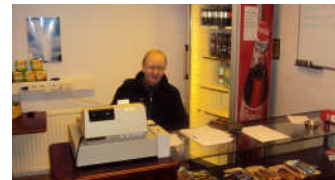
Félagi afgreiðir í sjoppunni.

Eldhúsdeildin sér um rekstur sjoppunnar. Til verkefna hennar telst sala á matar- og kaffimiðum, ávöxtum, gosi, sælgæti og kökum. Einnig sér sjoppan um að kaupa inn vörur sem þar eru seldar.