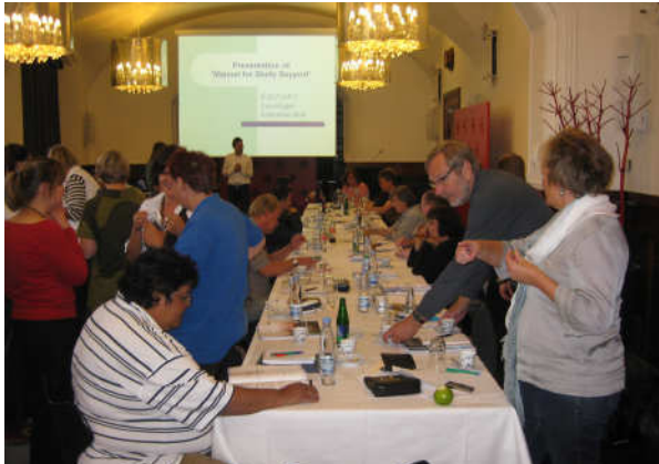
Frá lokafundi Elect verkefnisins í Kaupmannahöfn 20. – 23. september 2009. Fundurinn var haldinn í Ráðhúsi Kaupmannahafnar.

Félagi og starfsmaður fóru á fimmtánda alþjóðlegu ráðstefnu Fountain House sem