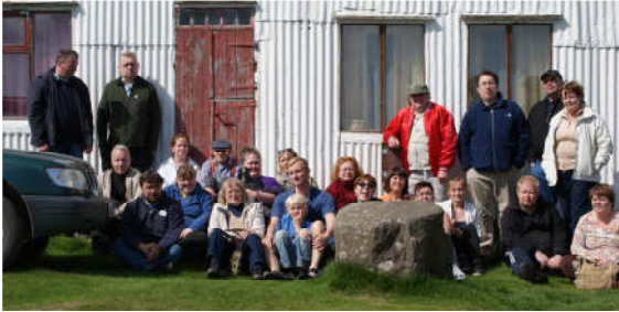
Myndin er tekin á Núpstað Vestur-Skaftafellssýslu í vorferð Geysis.

Þann 25. júní var farið í Krika við Elliðavatn, en það er hús í eigu Sjálfsbjargar í Reykjavík. Þar fóru félagar meðal annars farið í gönguferðir og svo var grillað.