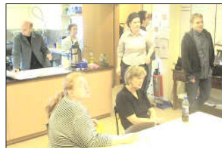
Hér að ofan má sjá þrjár svipmyndir frá fundinum.