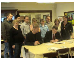
Jón Kristjánsson félagsmálaráðherra undirritar RTR samninginn við hátiðlega athöfn í Geysi

Endurnýjaður RTR samningur Geysis við félagsmálaráðuneytið var endurnýjaður á kynningar og aðstandendadaginn 17. maí. Starfið er til sex mánaða og felst í símsvörun,