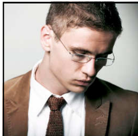
Víkingur Heiðar Ólafsson píanóvirtuós

Töframáttur tónlistar hefur hafið göngu sína á nýjan leik eftir sumarfrí. Þann 27.