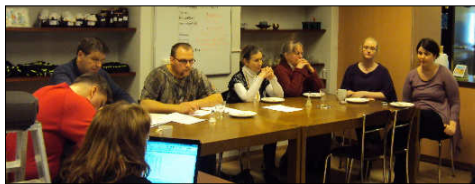
Myndin er tekin á húsfundi í Geysi 15. febrúar