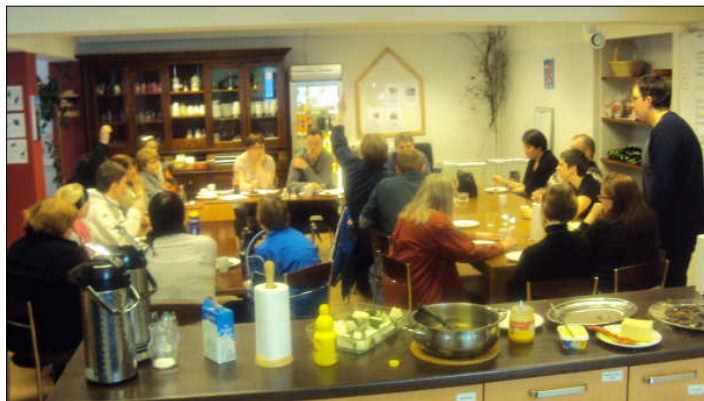
Mynd frá húsfundi 16. mars 2011

slíku fyrirkomulagi mætti fjölga og auka fjölbreytni í verkefnum eldhúsideildarinnar. Talað um undirbúning þorrablóts og fólk hvatt til að taka þátt. Undir liðnum önnur mál var rætt um vorferðarfund og fyrirkomulag fjáröflunar og hugmynd um að fara heldur í haustferð.