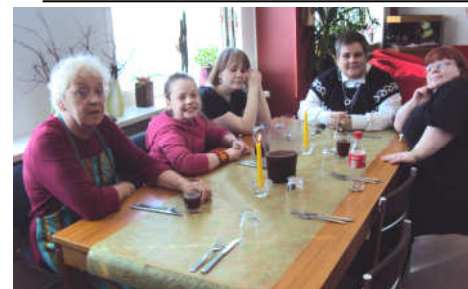
Myndin er tekin í páskaveislunni í fyrra