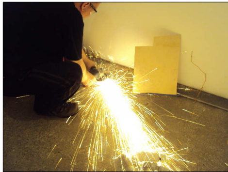
Neistaflug frá viðhaldsdeildarmönnum