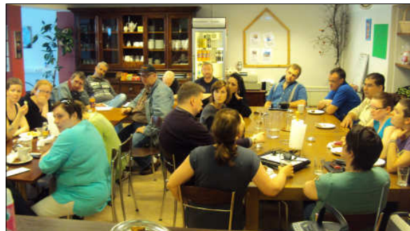
Myndin er frá húsfundi 11. maí, en grísku geðheilbrigðisvinir okkar sátu þann fund.

Miðvikudagurinn 30. mars: Rætt var um og boðað til ferðafundar fimmtudaginn 31. mars. Tóta tók að sér halda utan um ferðafundi. Forsvarsmenn frá AUS óskuðu eftir að fá kynningu fyrir tvo starfsmenn aðal-skrifstofunnar í Brussel. Vel