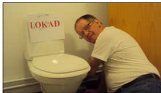
Þorkell skráfar frá vatninu

gömlum og illa slitnum dúk var skipt út fyrir fallegar og slitþolnar flísar og veggir málaðir, auk þess sem flísalagt var í kringum vask. Nú á aðeins eftir að setja upp baðklefann og finisera. Viðhaldsdeildin hefur staðið sig vel í þessum framkvæmdum og starfsmönnum hennar óskað til hamingju með vel unnið verk.