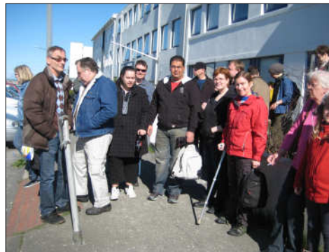
Hópurinn stillti sér upp fyrir utan Geysi áður en lagt var af stað.