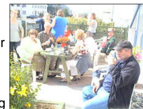
Myndin er tekin á blómavíku 2009 í Geysi.

verða seldar til styrktar Geysi og margt fleira skemmtilegt. Allir saman nú.