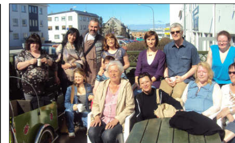
Myndin er tekin fyrir utan Geysi einn góðviðrisdag með Grikkjunum í vor.