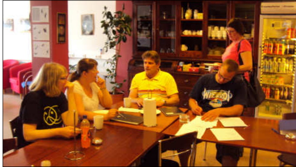
Frá húsfundi 20. júlí síðastliðinn