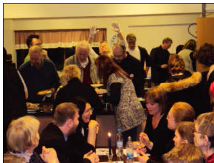
Fjölmennt var á þorrablótinu í fyrra

Húsið opnar kl. 18.00 og borðhald hefst kl. 19.00. Miðaverð verður kr. 2.000 og þurfa félagar að skrá